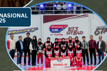
TIM BASKET PUTRI RAIH RUNNER UP DBL 2025