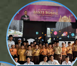
BAKTI SOSIAL 2025