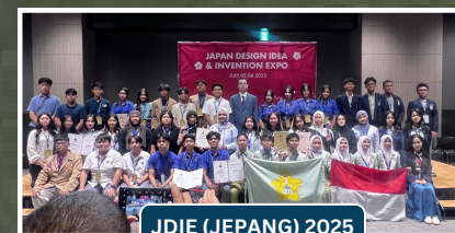
JDIE (JEPANG) 2025