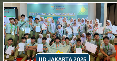
IID JAKARTA 2025